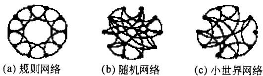
图 1 网络结构示意图

1.1.2 小世界网络模型 1998 年, Watts 和 Strogatz 提出了一种融合规则网络和随机网络优点的“小世界”网络模型 [1] (以下称为 WS 模型), 使我们对于网络中的局部和整体的辩证关系有了新的认识. WS 模型一经提出立即引起了科学界的轰动. 该模型既具有规则网络的高聚集性, 又具有类似随机网络的小的平均路径长度(如图 1(c)所示), 是一种具有良好特性的网络, 更好地反映了真实网络系统.